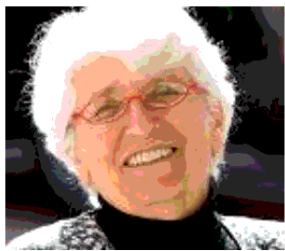
di Nicoletta Sipos